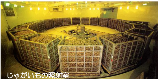
じゃがいもの照射室

現在日本で照射が許可されている食品は、じゃがいものみです。研究の結果、ガンマ線を70グレイ照射すると、収穫後8ヶ月の室温貯蔵で発芽を防止することがわかりました。1972年にじゃがいもの照射が許可され、1974年から北海道の土幌町農業協同組合が、発芽防止の目的でじゃがいもの照射を開始しました。