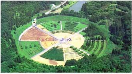
ガンマフィールド

茨城県常陸大宮地区の放射線育種場には、国内唯一のガンマフィールドがあります。自然の突然変異は起きる確率が低く、手に入れることは非常に困難です。そこで、放射線により誘発された突然変異を利用した作物の品種改良及びその効率的誘発のための基礎研究が行われています。品種改良は、放射線を当てることによって病気に強い新品種や寒冷地に適した品種（変種）を得たり、意図的に突然変異を起こさせ品種を作る技術です。ナシの黒斑病抵抗性品種が育成されたほか、イネやオオムギ等の耐倒伏性・多収穫・病害虫抵抗性の改良が進められています。病害虫による抵抗性の改良が進められると、農業はほとんど不要になり、環境汚染も著しく減少させることが可能となります。