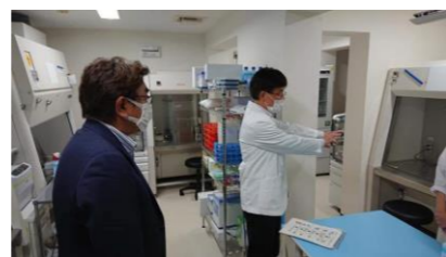
所員から説明を受ける